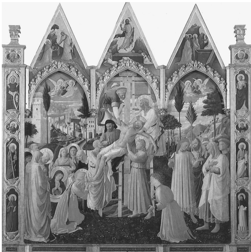
Een fresco van Fra Angelico in het San Marcoklooster in Florence (ongeveer 1435).

Ferrara te arriveren. 4 Zijn reisgenoten ergerden zich mateloos aan de vriendelijke houding die Isidorus onderweg tegen zijn katholieke gastheren aannam.