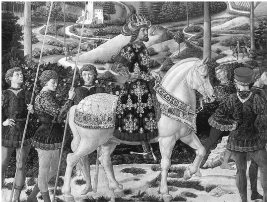
Keizer Johannes VIII Paleologus, detail van een wandschildering 'De reis van de Wijzen uit het Oosten' van Benozzo Gozzoli in het Palazzo Medici Riccardi, Florence 1459.

Isidorus werd naar alle waarschijnlijkheid tegen het einde van de veertiende eeuw in Thessaloniki geboren. Als monnik en abt ( hegoemen ) van het Demetriusklooster in Constantinopel verwierf hij daar enige faam door zijn grondige kennis van het Latijn. Hij onderscheidde zich bovendien als redenaar en als voorstander van vereniging van de orthodoxe met de katholieke kerk. Keizer Johannes VIII stuurde hem in 1434 naar het concilie van Bazel om te onderzoeken of een eventuele unie militaire steun vanuit het Westen zou opleveren. Isidorus hield daar een merkwaardige rede waarin hij de pracht van Byzantium schilderde. Het concilie verloor echter snel aan betekenis. Isidorus keerde naar Constantinopel terug waar hij door patriarch Jozef II tot metropoliet (aartsbisschop) van Kiev en Moskou werd benoemd. Vrijwel onmiddellijk na aankomst in Moskou bracht hij grootvorst Vasiliy II ertoe – zij het met moeite – hem aan het hoofd van een grote delegatie geestelijken en leken naar Italië te sturen. Wel had hij de grootvorst plechtig moeten beloven het aanzien van de kerk niet te zullen schenden.