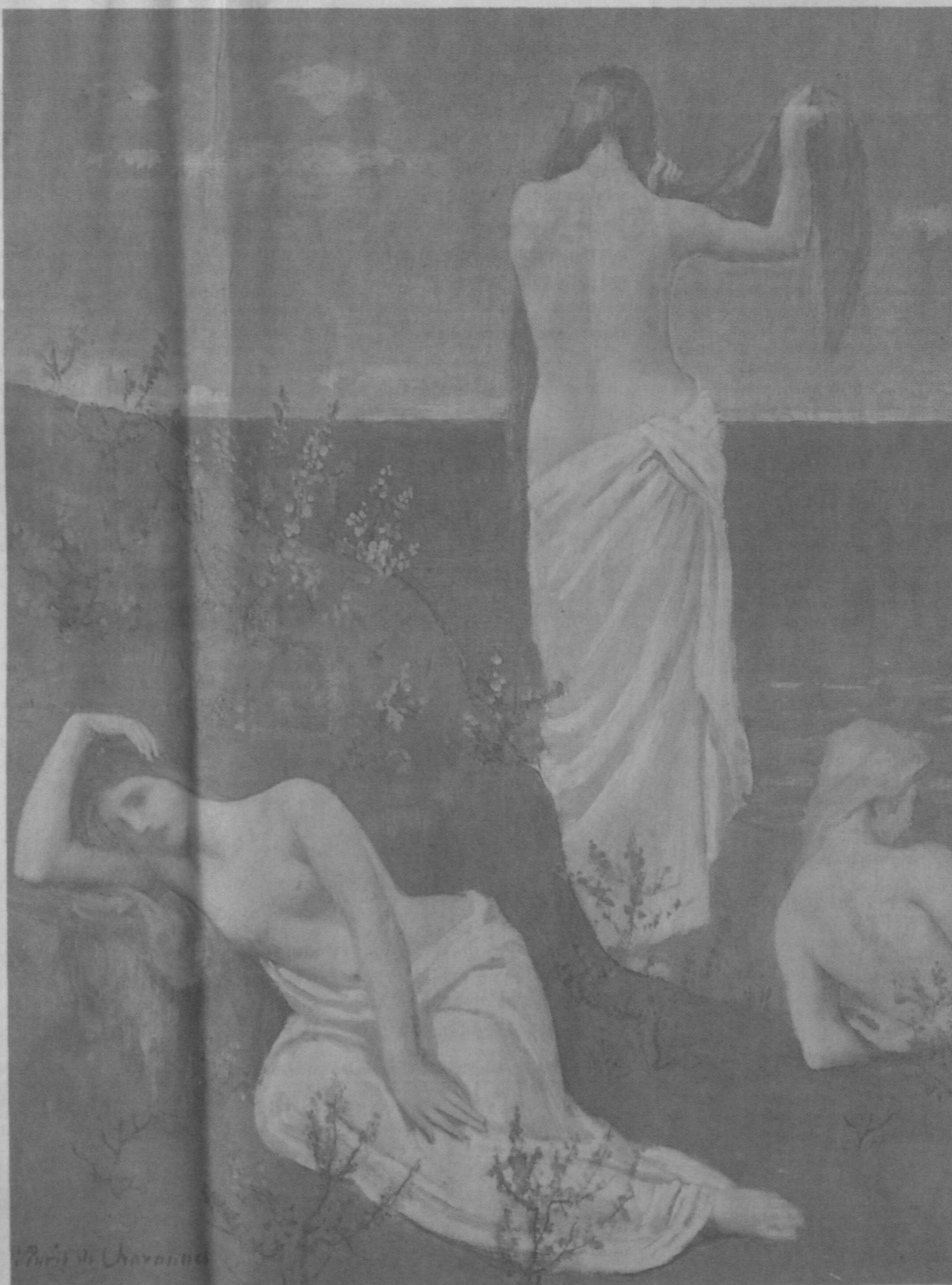
PUVIS DE CHAVANNES: JONGE VROUWEN AAN HET STRAND VAN DE ZEE, 1879

De tentoonstelling over Pierre Puvis de Chavannes in het Van Gogh-museum in Amsterdam duurt nog tot en met 29 mei.