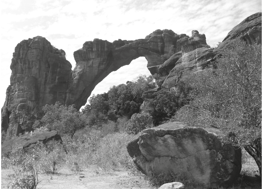
De poort van Kamajan nabij Siby, Mali (foto Reni Muller, 2009)

periode van vóór de Franse bezetting. 46 Zo is het landschap een theater voor het geheugen van de verteller die zich het verhaal kan herinneren door in gedachten door het landschap te reizen.