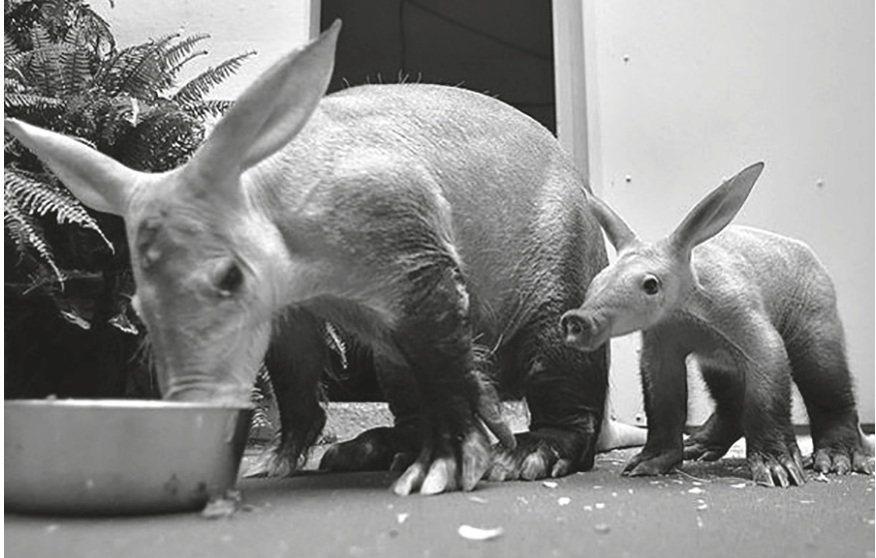
Aardvarken met jong ( https://commons.wikimedia.org/wiki/File:Aardvarks.jpg )

de nieuwe orde leeft als een aardvarken, een termietenheuvels-vernietiger bij uitstek, krijgt de stichter van moeders kant de kracht mee om de oude orde te vernietigen. De kracht van het aardvarken ondermijnt zo de macht van de smid! Daarnaast is het politiek gezien verstandig om een stichter geboren te laten worden uit een vrouw die ergens gevonden is of, zoals in de geschiedenis over Sunjata, als een prijs weggegeven wordt. Een dergelijke vrouw brengt geen schoonfamilie met zich mee en dus ondervindt haar zoon geen belemmering van verplichtingen en loyaliteit aan de familie van moeders kant. Doordat hij een 'wilde' moeder heeft, zonder banden met de maatschappij, kan de stichter zich helemaal richten op zijn rijk, zijn erfgoed van vaders kant. 18