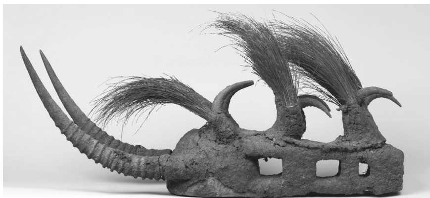
Komo-masker

Een vergelijking tussen de Franstalige en de Engelstalige Wikipedia-website over het Mali-rijk toont dat er variatie bestaat binnen dit beeld van Sunjata. Aan de ene kant staan de auteurs van de Franstalige website. Hun opvattingen zijn kenmerkend voor de wijze waarop men in West-Afrika op school over Sunjata leert. Deze auteurs hebben een groot geloof in de kracht van Afrikaanse vertellers om feiten uit het verleden generatie na generatie correct over te dragen. Zij zijn ervan overtuigd dat de verhalen over Sunjata verwijzen naar de eerste decennia van de dertiende eeuw. Zij beschouwen de orale tradities als in principe feitelijk historisch correct en de Arabische bronnen zien zij als ooggetuigenverslagen. 39