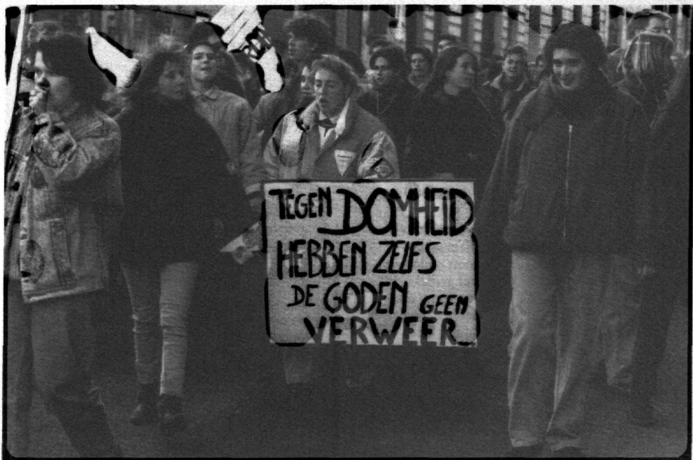
Publieke religie: 'een aantal gemeenschappelijke normen die men niet ongestraft kan schenden'

hebben, zo zou men kunnen zeggen, een charisma-tische lading.