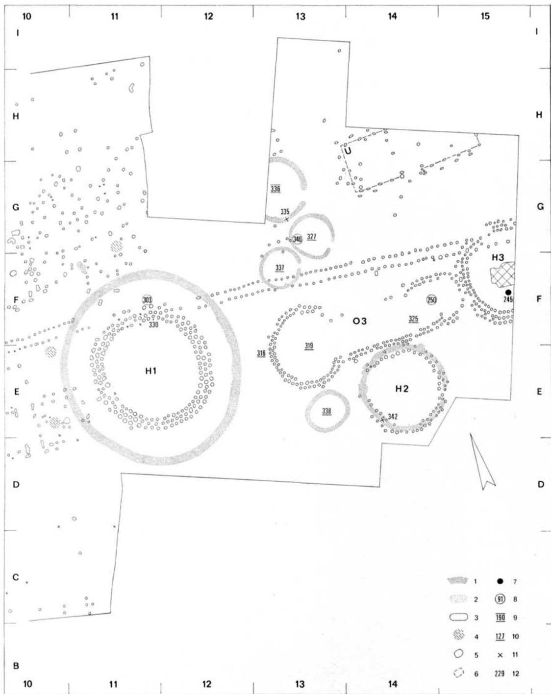
Beilage 2. Ausgrabungsplan, Mitte-Westen. 1 : 400.