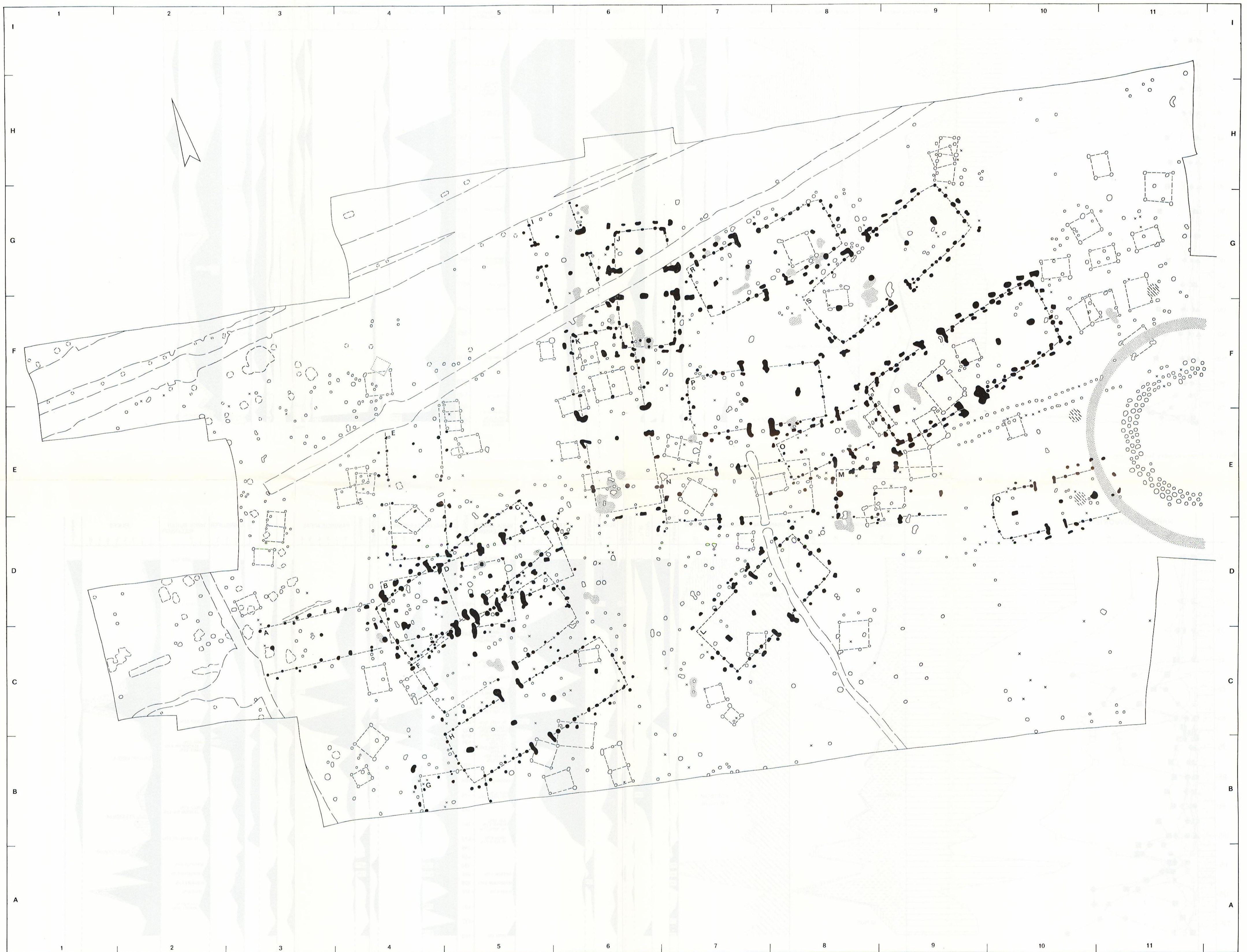
Beilage 1. Ausgrabungsplan, westlicher Teil. 1 : 200.