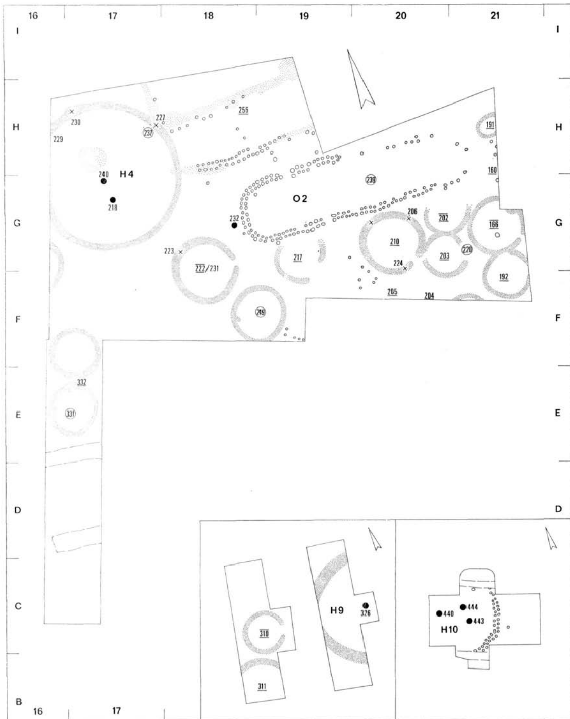
Beilage 3. Ausgrabungsplan, Mittelteil. 1 : 400. Im Ausschnitt: Suchschnitte in der Past. Hermansstraat, Siehe Abb. 1.