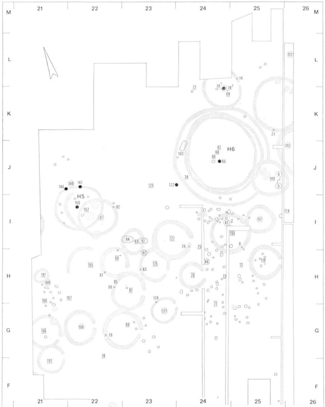
Beilage 4. Ausgrabungsplan, Mitte-Osten. 1 : 400.