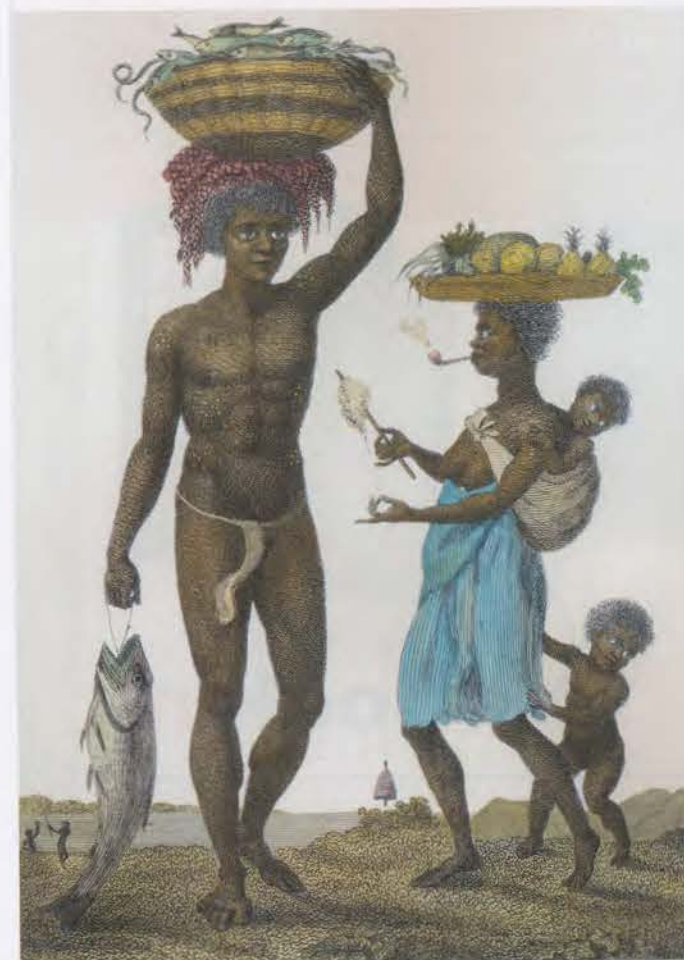
VERBONDEN SURINAAMS SLAVENGEZIN UIT BURKINA FASO Ets uit 1792 van William Blake.

Was suiker in 1500 nog een zeer kostbaar goedje voor de allerrijksten, in 1800 werd het breed gebruikt in de koffie en thee