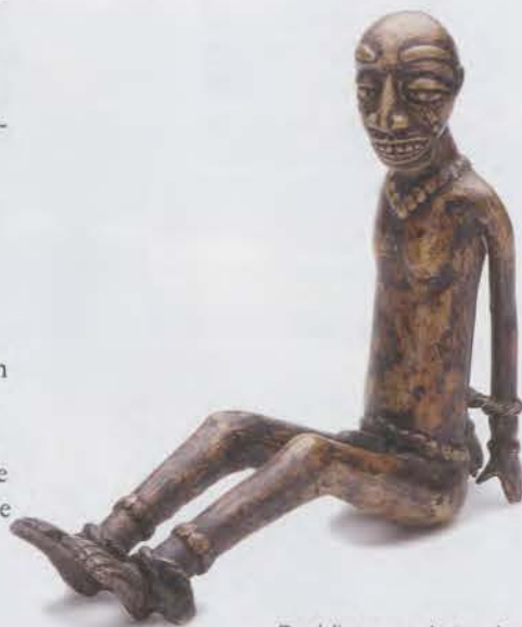
Beeldje van geketende slaaf (Kameroen).

Zolang we niet denken in termen van menselijke waardigheid en eerlijke internationale verhoudingen was het plantagesysteem een verbluffend succes