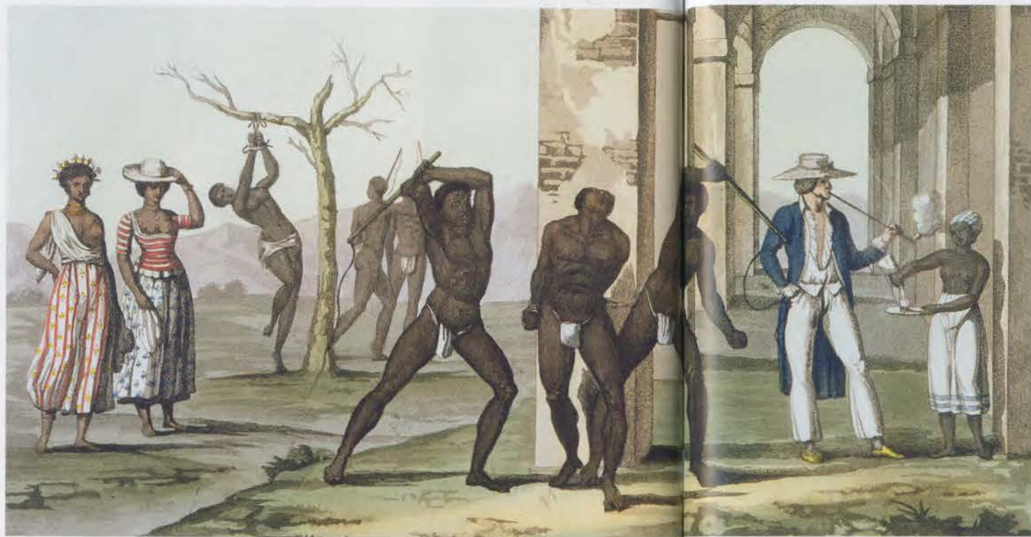
MACHT AFRIKANEN EN HUN NAKOMELINGEN KONDEN ALS BEESTEN WORDEN BEHANDELD 'Plantage in Suriname', gekleurde ets van G. Bramati uit de 19e eeuw.

De Nederlanders speelden daarbij een belangrijke rol. Om net als in Azië in de Amerika's koloniën te kunnen stichten, maar ook om een extra front tegen Spanje te openen, werd in 1621 de West-Indische Compagnie opgericht. Tot de weinige