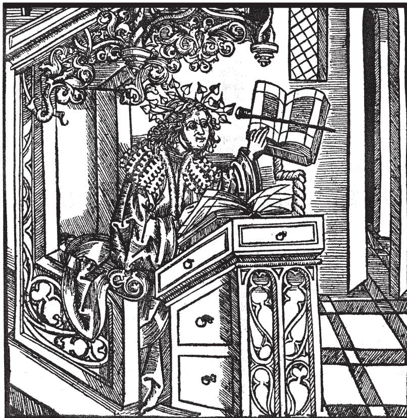
2. Portret van Jakob Locher (Philomusus). Auteursportret in: Jakob Locher, Panegyrici ad Regem [...] , Straatsburg 1497.