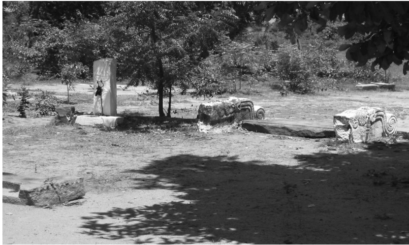
Fig. 4: De plek waar Van Senden de steen met de drietand vond heet nu Agasthiyar Stabanam. De steen is er niet meer, maar de resten van het oude tempeltje nog wel (zie foto). Er staat nu een ijzeren drietand op het veldje voor de tempel, naast de antieke trapleu-ningen. Het is een bedevaartsplaats, er wordt gezegd dat de kluizenaar en wijze Agastiyar er heeft gewoond.

en slecht bestudeerd is, moet in elk geval niet verward worden met een louter onzelfzuchtig beleid. 34