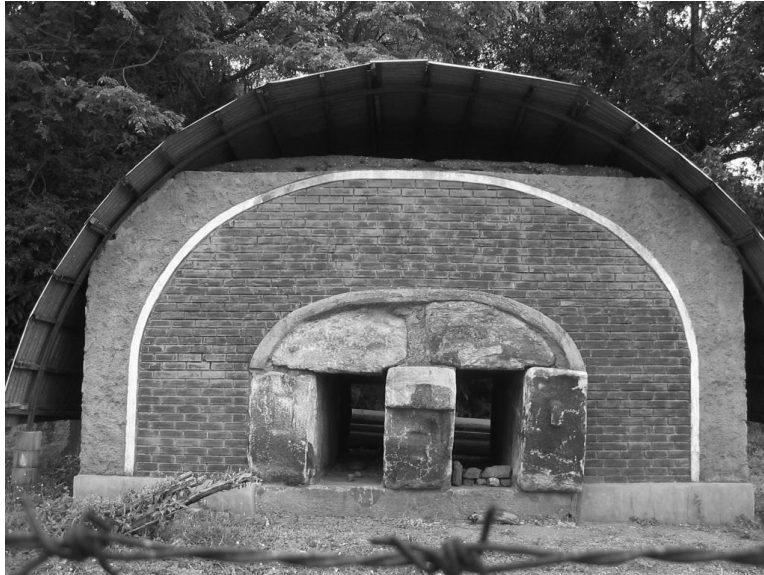
Fig. 3: Deze antieke sluis van Kantelai hebben ze gevonden toen de dam in de jaren 1950 werd opgeknapt. Hij staat nu op de dam als monument.