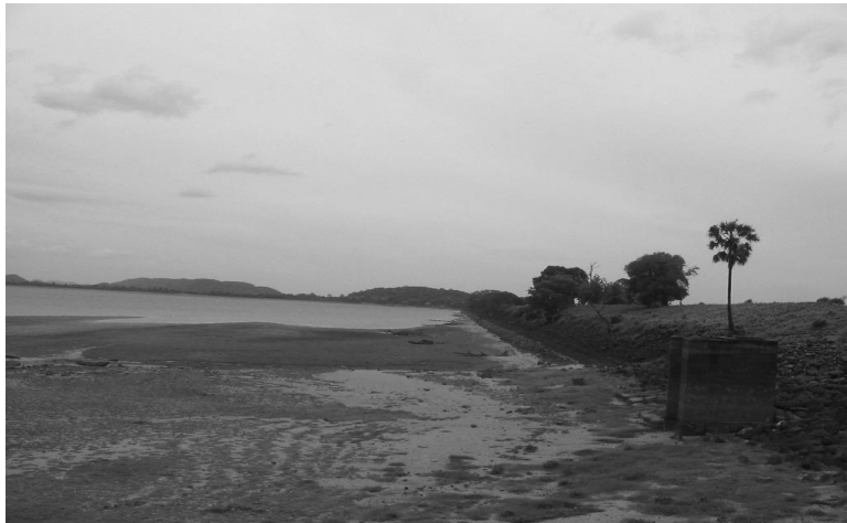
Fig. 2: Het waterreservoir van Kantelai. Omdat het erg droog was toen de foto genomen werd, is de stenen dam goed zichtbaar, normaal gesproken staat deze onder water. Foto's en informatie bij alle afbeeldingen: Timmo Gaasbeek.