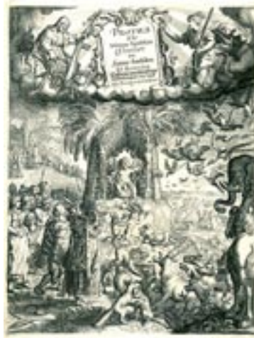
Emblemata van Jacob Cats

die ook zeer nuttig kunnen zijn in het kader van boekhistorisch onderzoek, worden onder meer de samenvattingen van de notariële akten van 1599-1811 digitaal toegankelijk gemaakt. Op dit moment wordt de mogelijkheid geboden om online in de notariële akten van Rotterdam (1599-1658) en Delfshaven (1666-1720) en in een gedeelte van het rechterlijk archief van Overschie (1627-1811) te zoeken. Een zoekactie kan één of meer uittreksels van akten opleveren. Een uittreksel is een samenvatting van een akte.