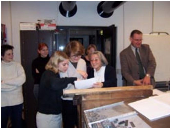
Visitors from Münster in the Press Room

In October we received a delegation of about fifteen students and staff from the Institut für Buchwissenschaft & Textforschung van de Westfälische Wilhelms-Universität in Münster, with which we are setting up a closer working agreement. After a brief tour of the university library and the Bibliotheca Thysiana, we discussed ways in which our joint interests and activities (you may remember the report on our joint Rothenberge workshop in the last issue) may be given formal shape in the future. A Socrates exchange agreement has since been officially signed, and the first student exchange is scheduled to take place in the coming academic year.