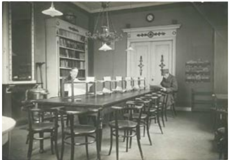
Courantenzaal in de Openbare Bibliotheek, Leiden

Er zijn nu plannen gemaakt om deze belangstelling te laten culmineren in een tentoonstelling die in het jaar 2007 gehouden zal worden in het Leidse Stedelijk Museum 'De Lakenhal'. Tijdens dit evenement zal de boekgeschiedenis van Leiden, die loopt van de Middeleeuwen tot en met de moderne tijd, op verschillende manieren gepresenteerd worden. Zo zal er bijvoorbeeld aandacht zijn voor de productie van handschriften in de Leidse kloosters gedurende de veertiende en vijftiende eeuw. Natuurlijk komt ook de