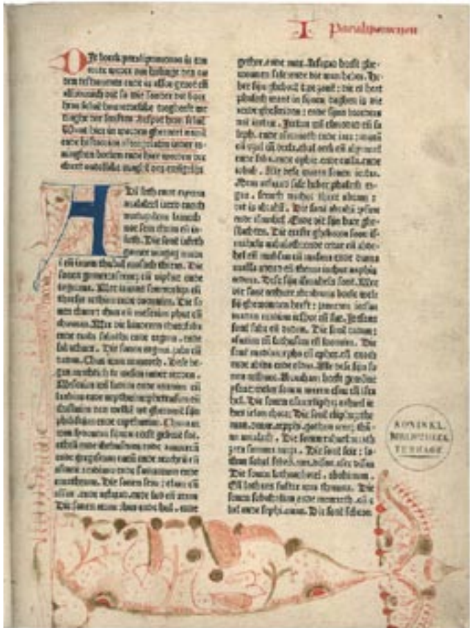
Bladzijde uit de Delftse bijbel (17e eeuw)

Door de introductie van de kopergravure kregen de illustraties veel meer detail. Van de beroemde zeventiende-eeuwse illustrator Romeyn de Hooghe zijn enkele prenten te bewonderen. Op een daarvan is de moord op de gebroeders De Witt te zien. Er is geen