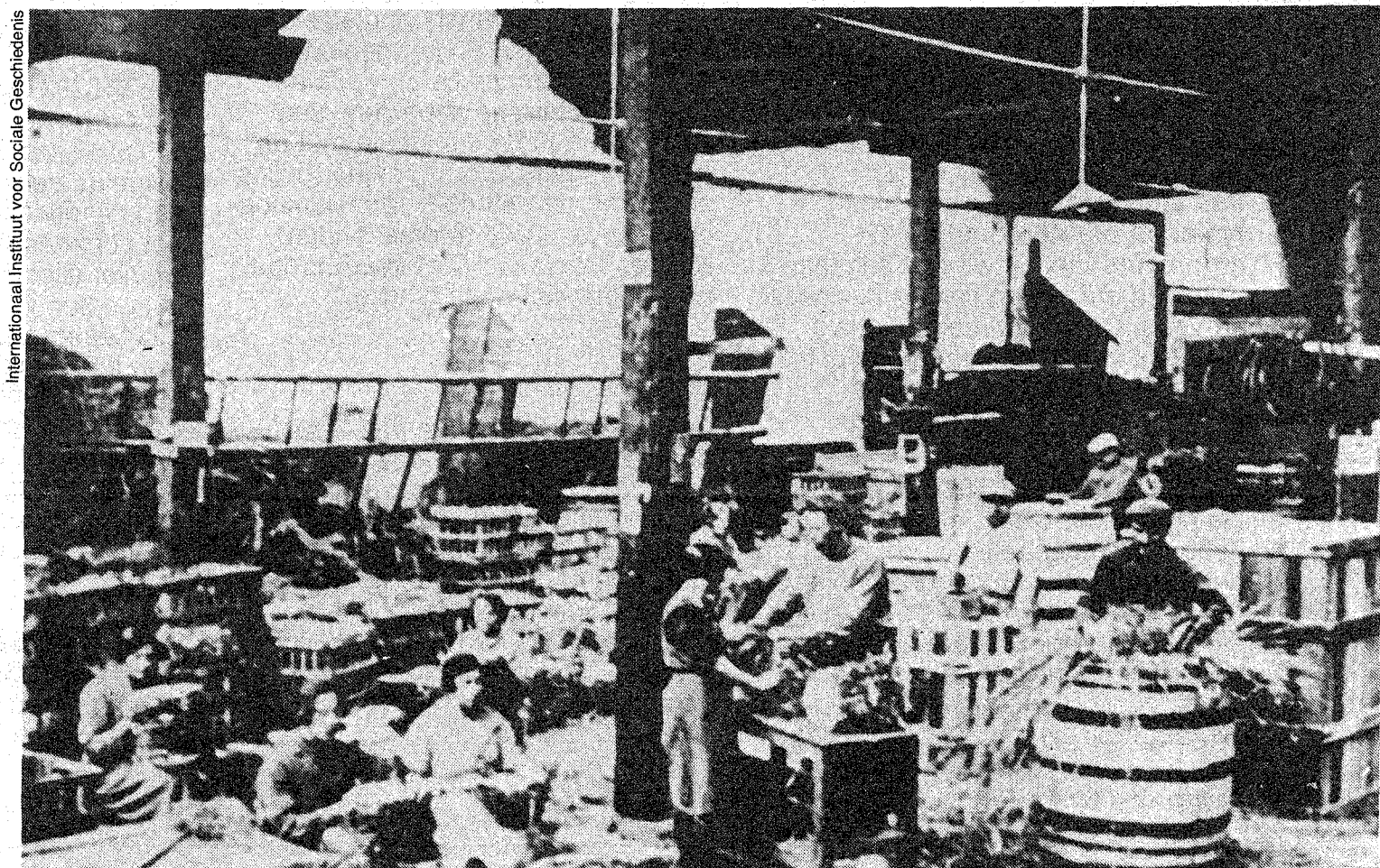
Internationaal Instituut voor Sociale Geschiedenis

Met de woorden veiligheid, gezondheid en welzijn koos hij precies die termen die bijna honderd jaar later nog als doelstellingen van de Arbwet zouden fungeren. Als de staatssecretaris nu deze begrippen tot uitgangspunt