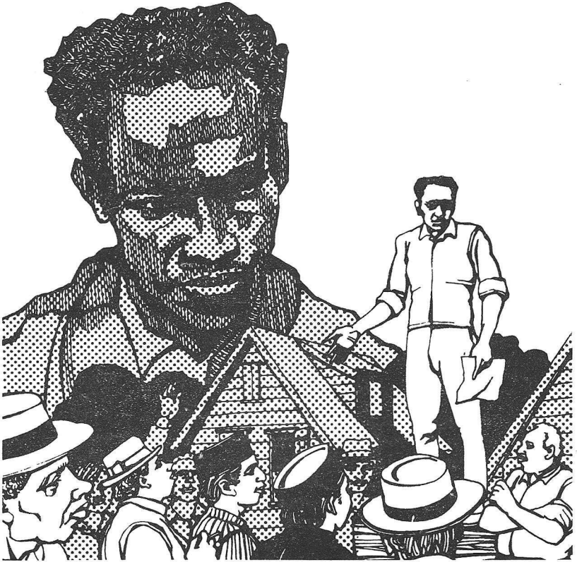
Poster naar aanleiding van de uitgave van Anton de Koms 'Wij slaven van Suriname' (1986)