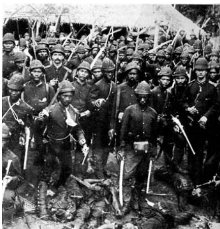
Afb. 2 K.N.I.L. in Atjeh

Dit detachement doet denken aan wat we nu special forces plegen te noemen. De infanteristen werd opgedragen van het land te leven zodat ze langer in het veld konden blijven om continue jacht te maken op de leiders van het verzet en hun directe volgelingen. Het vreemdelingenlegioen vervulde naar alle waarschijnlijkheid deze rol in Marokko en had uiteindelijk een niet onbelangrijk aandeel in de verovering van het land. 31 Mocht het verzet zich toch uitbreiden, dan kwam er een grote colonne aan te pas, vaak een overmacht met gebruik van veel attrition. Zo werden er in 1916 bij Wadi Kiss zesduizend soldaten opgetrommeld: 'It was like shooting fish in a barrell.' 32