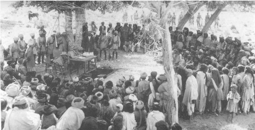
Afb. 3 Vergadering van Afghaanse stamoudsten of Jirga met Britse soldaten

De Britse historicus Tim Moremann concludeerde in een artikel over de Britse aanpak van guerrilla tussen 1919 en 1939 op de NWFP: ‘This combination of social, economic and political measures, backed by the use of force, has been characterized as a “hearts and minds” policy.’ 42 Lord George Curzon, de onderkoning van India, legde in 1898 de basis voor deze aanpak met zijn ‘economische penetratie’, de Modified forward policy . Goederen in ruil voor steun aan het gezag en het beveiligen van de handelsroutes waren de belangrijkste kenmerken. Daarnaast stelde hij ook lokale bestuurders aan, patwaris of kanungos genaamd. 43 Vanaf 1919 werd dit systeem op de NWFP verder uitgewerkt. De dorpschoude, maliks , kregen geld om milities op te richten. Zij gingen hun eigen gebied bewaken. Zo ontstond er een systeem van watch and ward , waarmee de Britten van de NWFP een bufferzone wisten te creëren tussen India en het onrustige buurland Afghanistan, waaruit in grote mate stammen al plunderend over de grens heen en weer trokken.