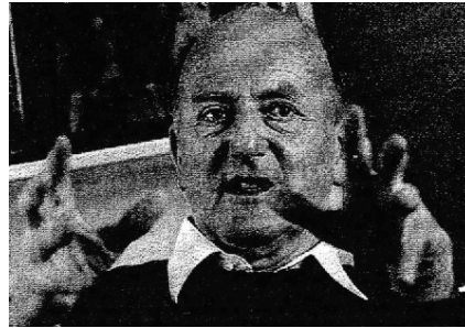
John Röhl (1938)