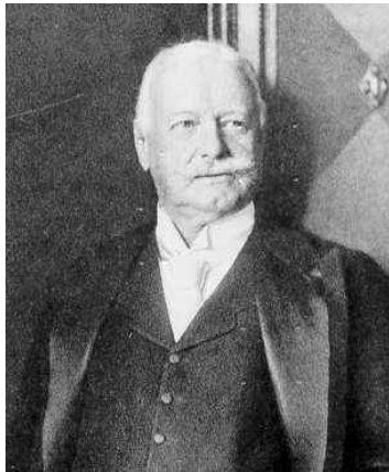
Bernhard von Bülow (1849-1929)

Vandaag de dag zijn er zeker ook historici die artikel 227 en 231 van het verdrag van Versailles niet als juist accepteren. Helaas echter zijn ze tot nu toe nog niet bereid geweest daar dan ook de consequenties aan te verbinden. Als Duitsland dan niet schuldig – of niet de enige schuldige – aan de oorlog is geweest, wie was of waren dat dan wel – of wie was of waren dat dan ook – en waarom heeft men dan de rol van die ‘andere’ – of mede – schuldigen niet nog eens aan een indringend onderzoek blootgesteld? Evenzo is het met de bewering dat Wilhelm een oorlogshitser is geweest en persoonlijk verantwoordelijk moet worden gesteld voor de vreselijke oorlog van 1914-1918. Ook hier vinden we tegenwoordig historici die vinden dat Wilhelm die kwalificatie niet verdiende. Maar hoe komt het dan dat we deze bewering toch nog steeds terug vinden in veel recente literatuur? Erkend moet natuurlijk worden dat het ook Wilhelm zelf is geweest die vaak mede debet was aan het feit dat hij zo’n slechte pers heeft gekregen, maar dat betekent nog niet dat de beschuldigingen terzake ook