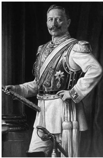
Wilhelm II (1859-1941)

Karl Kautsky, die na de oorlog van de Weimar regering opdracht kreeg de daden van de Duitse regering en de keizer te analyseren en te