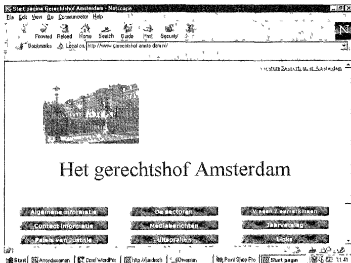
Afbeelding 1: Home-pagina van het gerechtshof Amsterdam

In Nederland zijn er eigenlijk maar enkele rechterlijke organisaties die uitspraken en vonnissen op het Internet publiceren. Zo