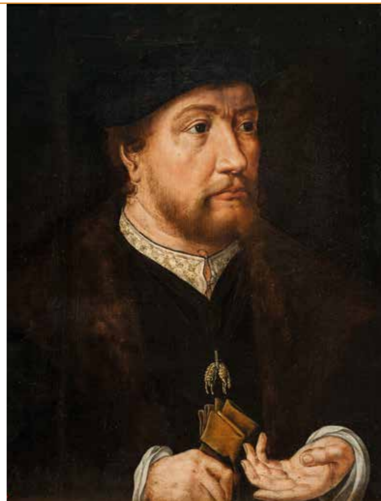
Linksboven: Jan Gossaert, Portret van Hendrik III van Nassau-Breda , ca. 1516-1517. (Olieverf op paneel, 57,2 x 45,8 cm. Collectie: Kimbell Art Museum, Fort Worth, Texas) Rechtsboven: Jan Gossaert, Portret van Hendrik III van Nassau-Breda , ca. 1530-1532. (Olieverf op paneel, 44 x 33 cm. Collectie: Museu Nacional d'Art de Catalunya, Barcelona)